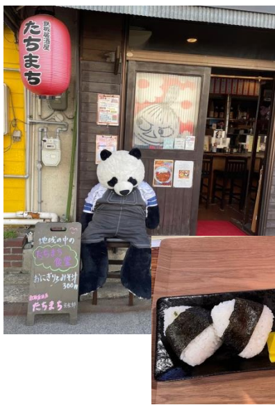
たちまち 食堂の様子

「認知症カフェは、認知症の方とその家族などが気軽に集い、交流できる場所です。医療、介護、福祉などの専門職による相談やサービスに関する情報提供、認知症に関する講習会の開催など、身近な地域の人も関わり、地域全体で支援していく取組です（広島市のホームページより）」