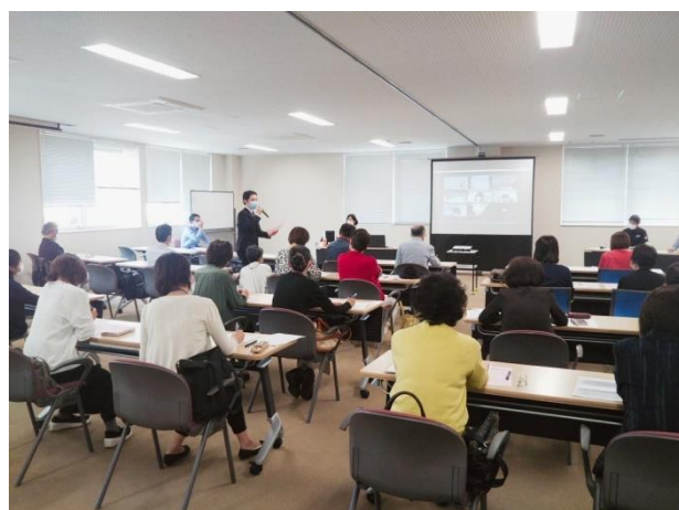
前回の観音認知症応援団の様子