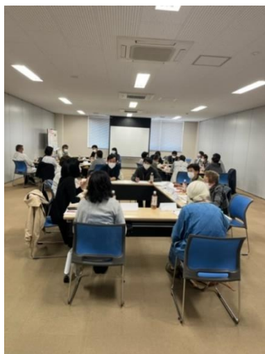
認知症カフェ店長連絡会の様子