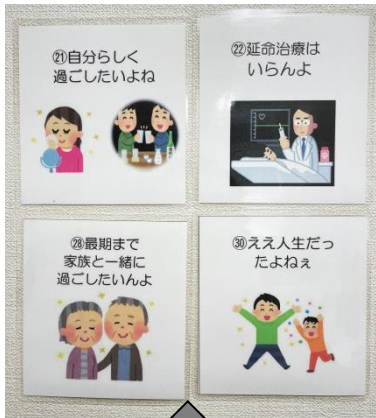
カードの一例 ～イメージしやすい広島弁とイラストのカード (講師作成)～

ACPについては、引き続き地域のサロンや医療と介護の連携会議等で取り組んでいきますので、みなさま機会があればぜひご参加下さい。