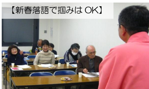
【新春落語で掴みはOK】