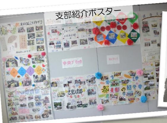
支部紹介ポスター