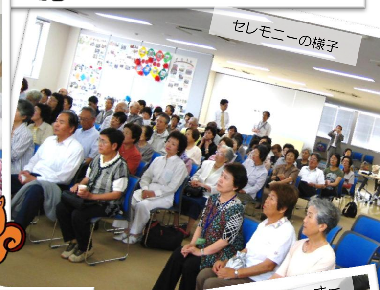
セレモニーの様子