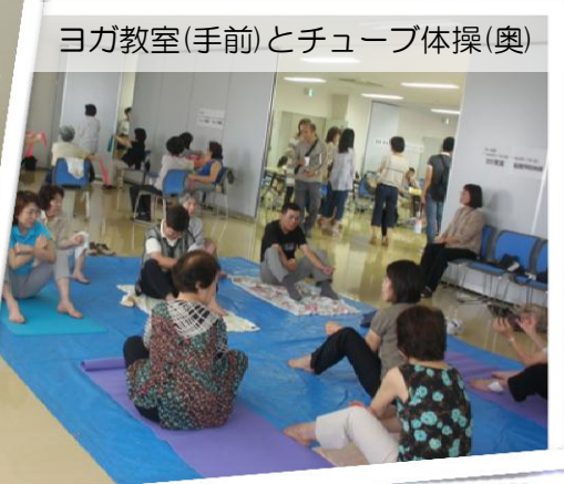
ヨガ教室(手前)とチューブ体操(奥)