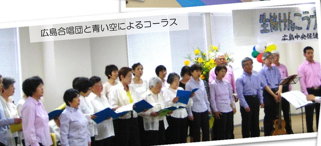
広島合唱団と青い空によるコーラス