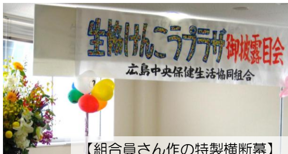
【組合員さん作の特製横断幕】

7 月 15 日 13 時より、生協けんこうプラザにて御披露目会を開催しました。前日まで豪雨が続き、天気が心配されましたが当日はなんとか薄曇りになりました。どのくらいの来場者になるかも心配でしたが、13 時の開場前に、受付には人だかりが！およそ 180 人の来場者で会場は埋まり、実行委員会も胸をなでおろしていました。