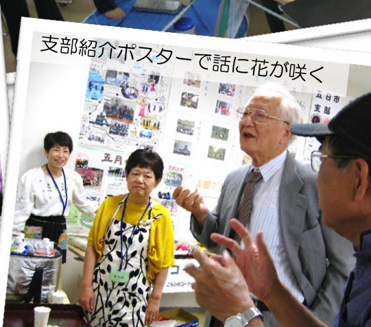
支部紹介ポスターで話に花が咲く