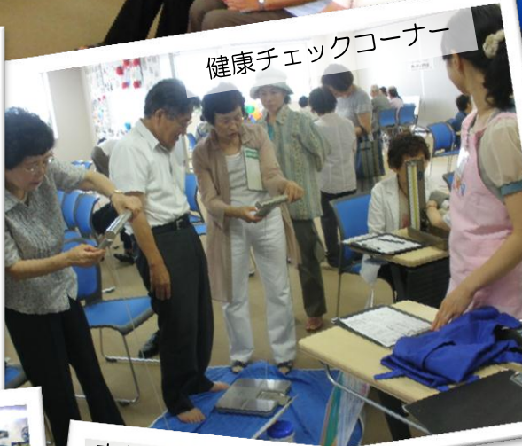
健康チェックコーナー