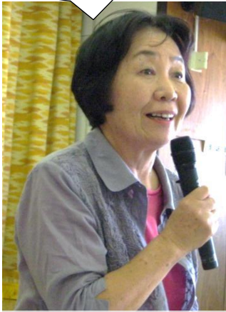
【閉会の挨拶する近江理事】